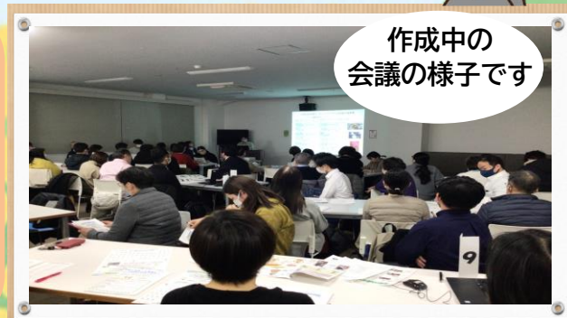
作成中の 会議の様子です

大浦地域では、「運動習慣がほとんどない。」「食べ物を噛みにくくなった。」といった問題を抱える方が多いというデータがあがっています。 住み慣れた地域で、安心して生活ができるよう、地域の医療機関と連携し、カレンダーを作成しました。 是非飾っていただき、皆様の健康の一助として役立てていただくと幸いです。